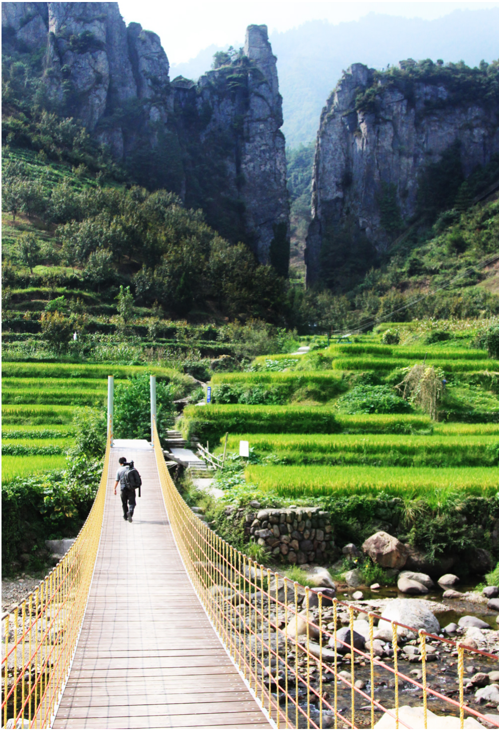
雄伟的小石门入口已整修一新。

要想富、先修路，“路”的长度和宽度，在很大程度上同时决定了马啸建设的快与慢。马啸乡深知一条路对一方百姓的意义，尽早破解交通瓶颈，才能使马啸的绿色经济发展真正步入快车道。