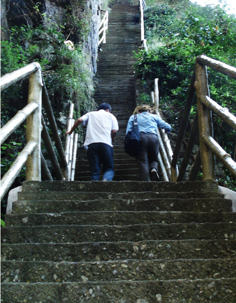
游客们在攀登小石门

据了解，剑门十八瀑景区是从原石长城景区延续下来的，2007年因原石长城景区旅游公司经营不善，管理不到位，造成了景区工作人员严重短缺，景区