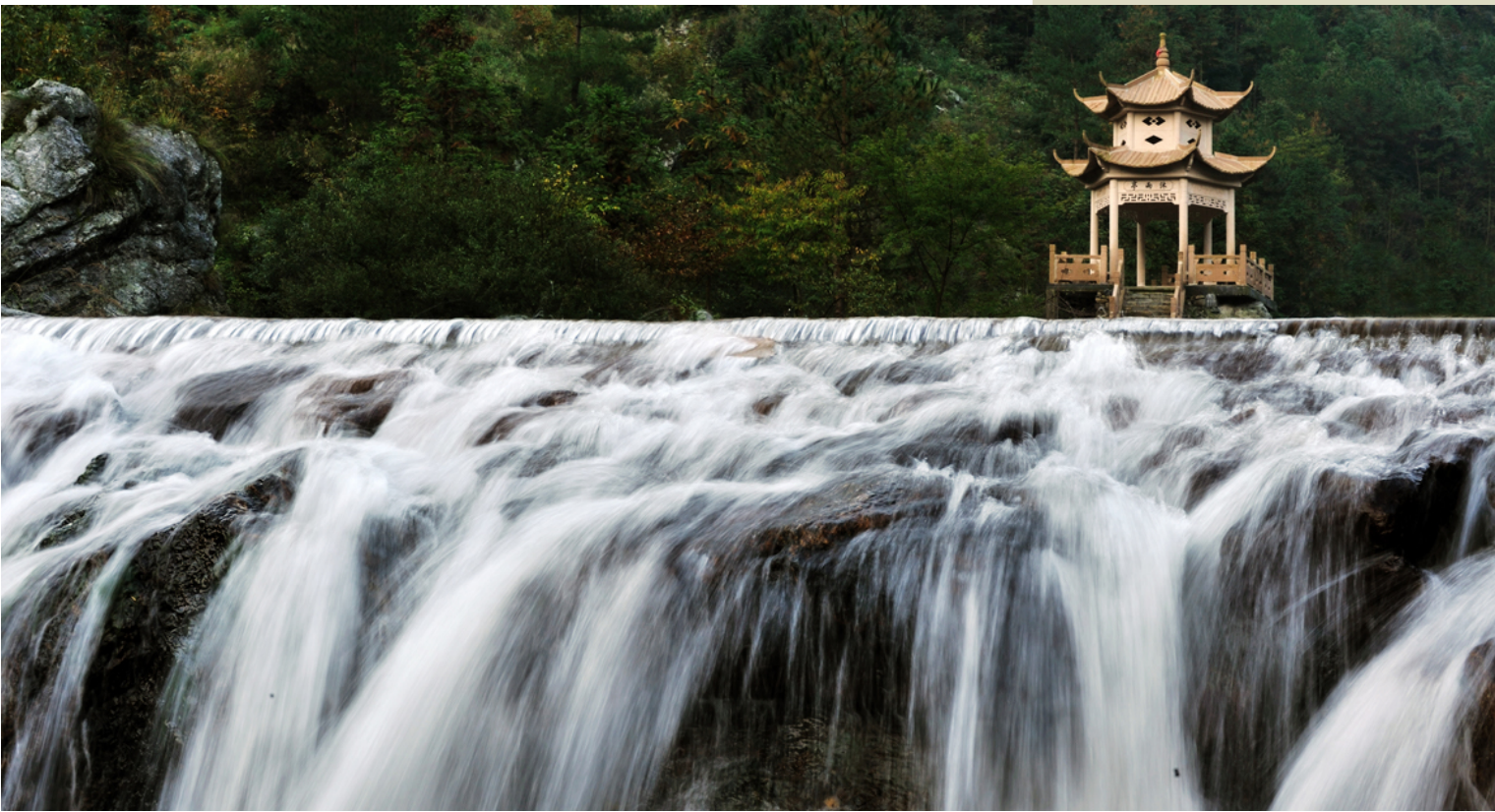
龙门景区内的流水霸气横生，吸引着四方游客。

在下一步工作中，马啸乡也将继续做强做大山核桃、旅游、小水电、高山蔬菜四大产业的前提下，促进农业产业结构的调整，大力推广高山四季竹、香榧、杨桐三大新兴产业，出台奖励扶持政策，形成规模效益，逐步形成四加三的新产业格局，为新马啸的生态产业发展增添新活力。