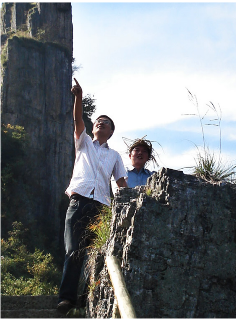
站在小石门顶上极目远眺

马啸作为一个农业资源大乡，老百姓的主要经济收入靠的是山核桃、高山蔬菜，竞争的优势在于时间差。马啸乡不容乐观的交通状况制约了菜农及贩销人员的增收路子。当前马啸乡工业企业因为交通，也曾普遍面临着招工难的尴尬局面。由于观念陈旧，当地老百姓恪守“耕读传家”的理念，不愿进厂务工，同时交通、基础设施的滞后，外地民工不愿意进来，来了也难留住，这样的恶性循环使得马啸乡的