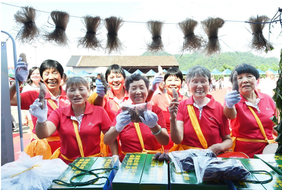
天目小香薯文化节