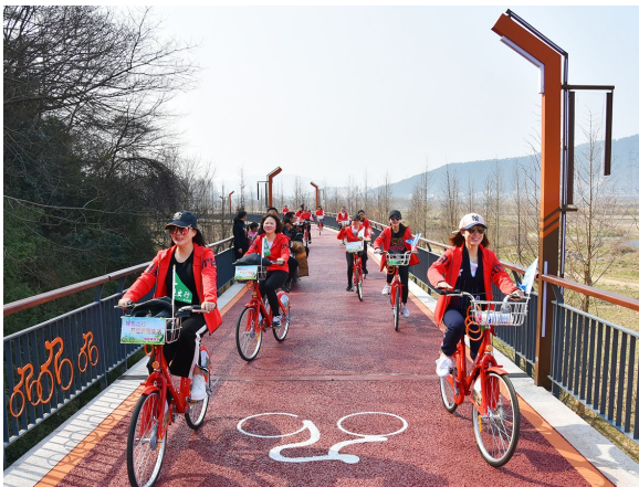
绿道骑行

为进一步宣传展示绿道建设成果,日前,省建设厅会同省林业厅、农业厅、交通运输厅、旅游局等7个厅局开展全省第一届“浙江省最美绿道”评选活动。经过前期申报,目前确定了30条“浙江最美绿道”候选名单。我市的青山湖环湖绿道位列其中。