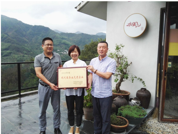
为相见酒店管理有限公司授牌

近日,杭州市委办公厅和杭州市人民政府办公厅联合下发了“关于表彰杭州市科技创新突出贡献企业(单位)及优秀经营者(个人)的通报”,对于2016年度推进杭州市经济转型升级、创新发展中做出突出贡献的企业单位和优秀经营者进行表彰。我市相见酒店管理有限公司获得杭州市2016年度“现代服务业先进企业”荣誉称号。