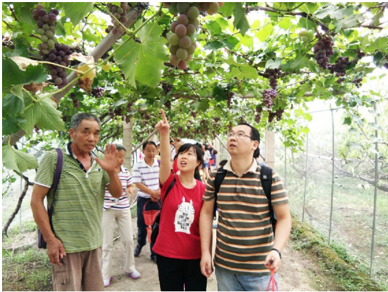
板桥采摘

种梨卖果,种稻卖粮,种茶卖叶,一年劳作只收获一季的农业,如何才能实现“全年卖风景”?“农业+旅游”刚好能满足这种需求。农业旅游是指利用农村的自然风光作为旅游资源,提供必要的生活设施,让游客从事农耕、收获、采摘、垂钓、饲养等活动,享受回归自然