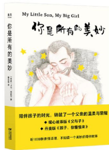
作者:卡尔·埃瓦耳 出版社:云南美术出版社 出版时间:2018年9月 价格:39.00元

作者晚于安徒生40年,被称为“丹麦童话王国”的另一座高峰;内上个世纪二十年代出版过他一部作品,由鲁迅的学生李峰翻译,鲁迅校对,周作人做序推荐,对爱华尔德的科学童话有很高的评价。