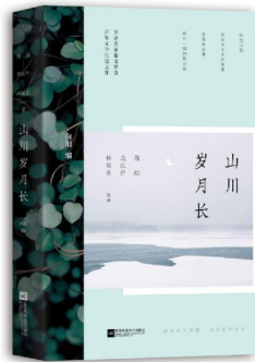
作者:蒋勋、龙应台、林清玄等 出版社:江苏凤凰文艺出版社 出版时间:2018年10月 价格:49.80元

龙应台,1952年生于台湾,被誉为“华人世界率性犀利的一支笔”,33岁着手写《野火集》,21天内再版24次,对中国两岸