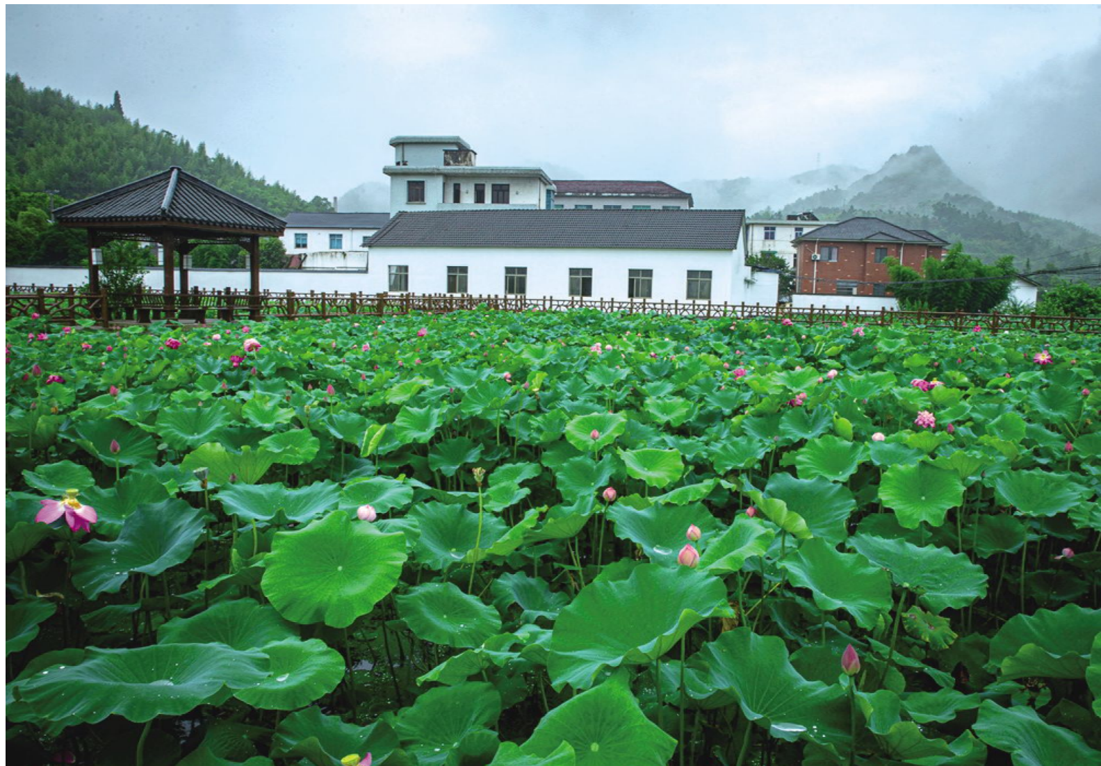
美丽乡村,景上添“荷”,玲珑街道祥里村的荷花雨后更妩媚