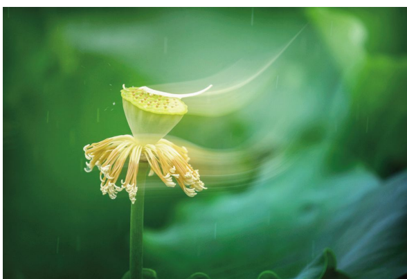
一阵急雨,把舞台留给了莲蓬