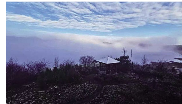
初雪后的清凉峰雾气缭绕,宛如仙境