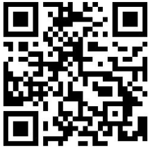
扫二维码详细了解

下雪了!下雪了!下雪了!万众期待,临安入冬后第一场雪终于来了。11月28日晚8点20分左右,浙江杭州临安清凉峰国家级自然保护区下雪了,差不多一小时后,地面上已经积起了薄薄一层!你有看到下雪了吗? 又一个冬天,又一场雪,熟悉又陌生。一场雪,是一个冬天里盛大的惊喜。每一场雪,都是一次心动的遇见,一起来欣赏这场初雪。