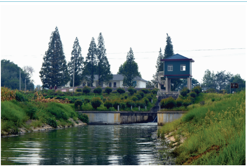
8月12日,柯坦镇古埂舒庐干渠管理段开闸放水,为柯坦、乐桥两乡镇旱区双晚禾苗紧急送水,使沿渠两岸5万多亩农田得到及时灌溉,缓解了紧张旱情。