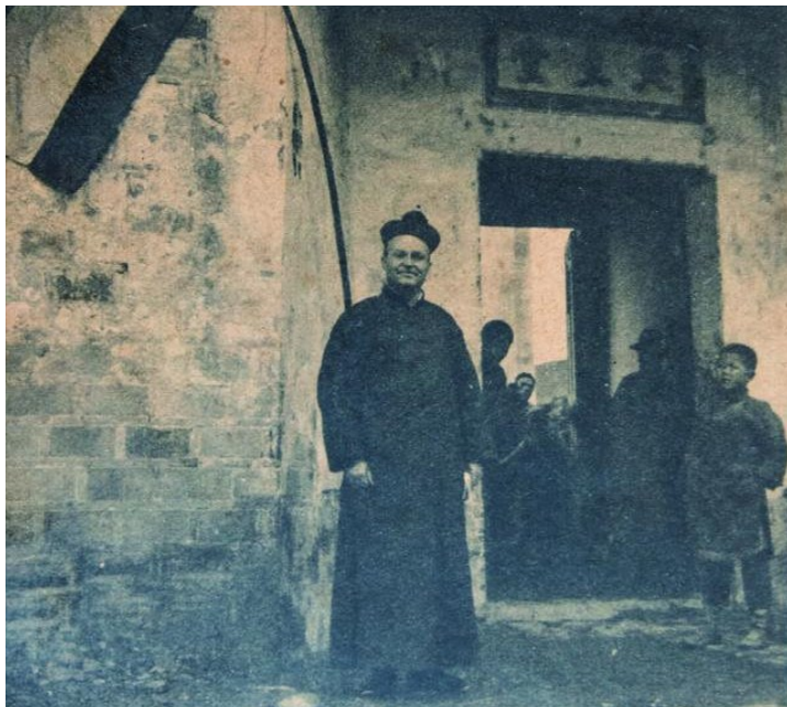
◀ 郎溪天主教堂(左一为西班牙传教士)