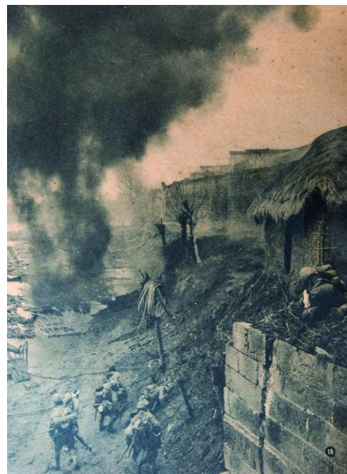
▲ 1940年2月21日,日本人正在攻郎溪城

东西大街以北有巷十七条,分别是:蒋家巷、汪家巷、小珠巷、太平巷、大同巷、油坊巷、花园巷(即今三郎巷)、伞巷(即今十字街至新华书店段)、四牌楼巷、寺巷、县府巷、火巷、三星巷、腊梅巷、当铺巷、石家巷、殷家巷。