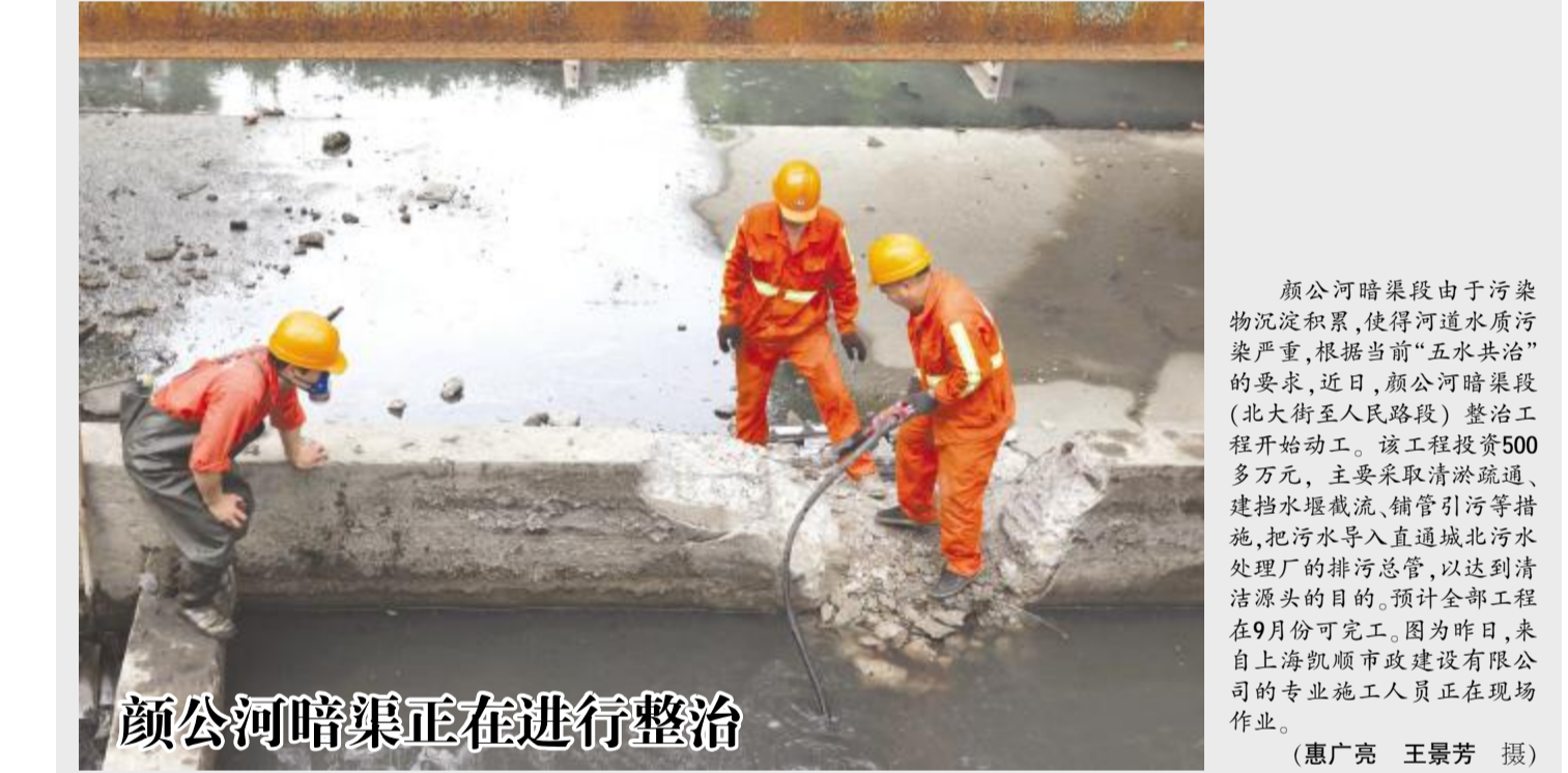
颜公河暗渠正在进行整治

休渔期间, 县海洋渔业局将对重点海域、港口、码头进行检查, 严厉打击违反伏休、“三无”、“套牌”船舶非法捕捞、收购违禁渔获物等违法行为, 对违反休渔禁渔规定作业的渔船一律“从重、从严”处理, 确保伏季休渔局势稳定。