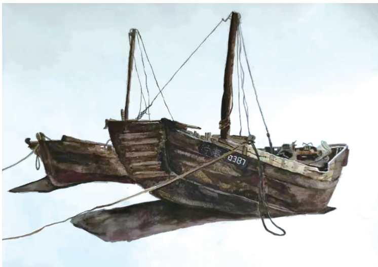
泊 城关中学初二(4)班 章文烨