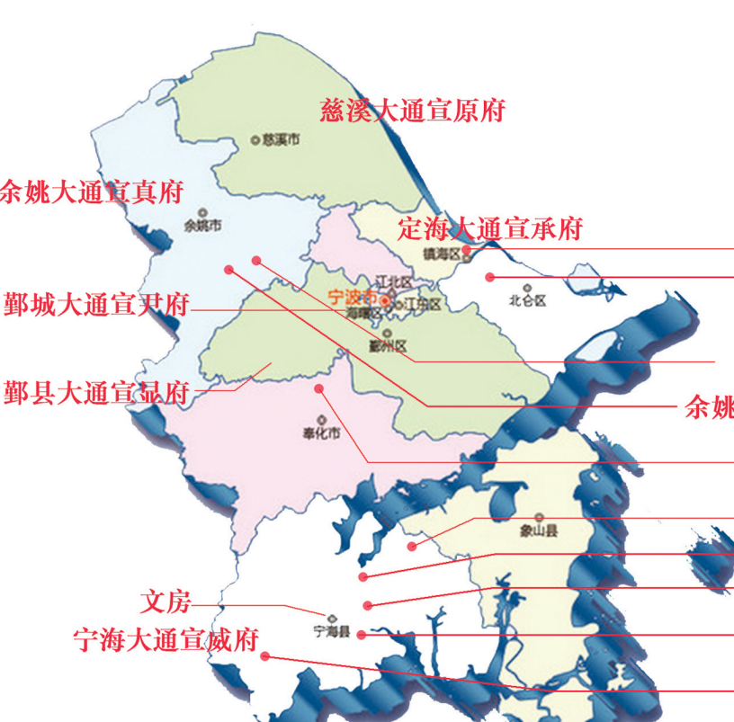
宁波葛洪文化遗存分布图

2、宁波民间的葛洪信仰 葛洪隐居北仑曰“瓶窟山”炼丹时，宁波瘟疫流行。葛洪采集草药，为民间治病防疫，挽救生灵。因“葛仙翁炼丹妙药”，故称药坞山岩为“灵岩”，山名“灵峰”。灵峰寺建有“葛仙殿”，灵峰寺葛洪信仰，据记载最晚自唐代已