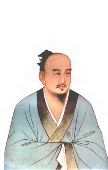
最经典的葛洪画像