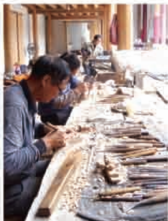
福建平潭古戏台正在修缮中