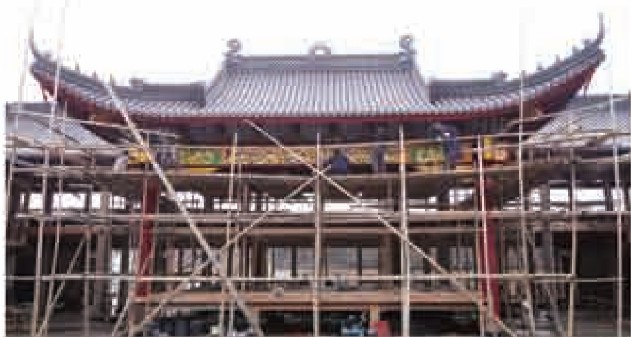
福建平潭古戏台正在修缮中

在福建,古戏台是乡村文化的重要载体,也是乡村民俗的重要载体。随着乡村经济的快速发展,乡村建戏台已经成为一种新时尚。在福建,古戏台是乡村文化的重要载体,也是乡村民俗的重要载体。随着乡村经济的快速发展,乡村建戏台已经成为一种新时尚。