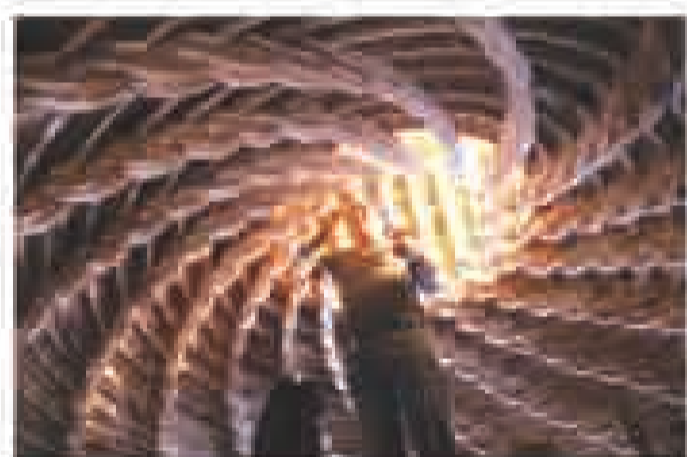
福建平潭古戏台正在修缮中