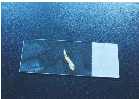
经鉴定，该寄生虫为鄂口线虫