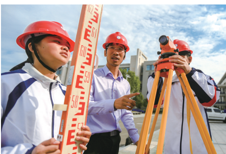
宁海一职高建筑专业学生在实习

“全国职教看浙江,浙江职教看宁波”。历经32年的改革发展,宁海职业教育在宁波甚至全国都举足轻重,已成为全国职业教育改革发展的排头兵。