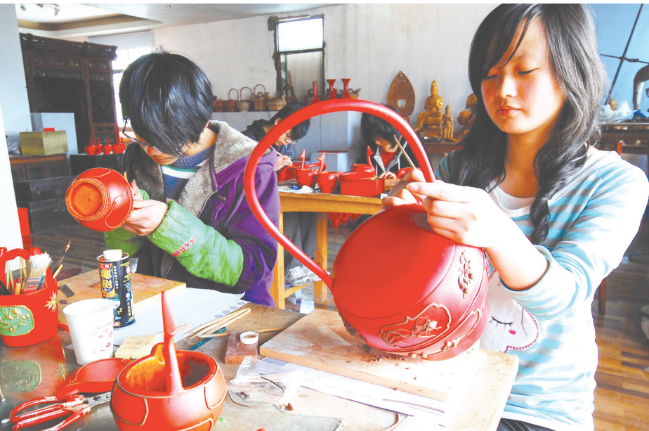
宁海一职高学生成为国家级“非遗”传承人