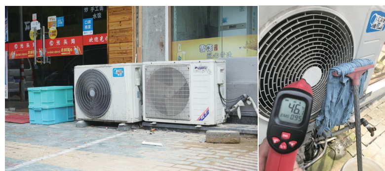
空调外机吹出的热风实测温度达46℃