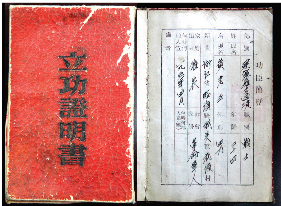
在部队荣获一等功证书与勋章