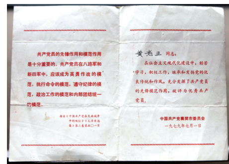
退伍后曾出席陕西省先进生产者代表会议,获评湖北省襄樊市优秀共产党员等