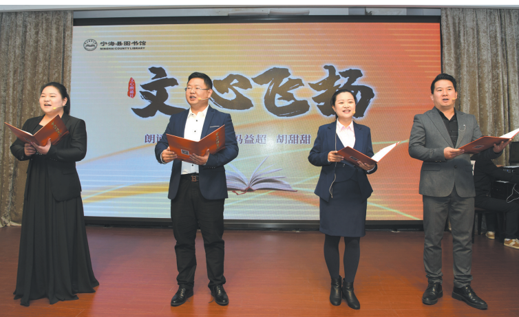
图为朗诵社成员正在激情澎湃地朗诵。

通讯员 吕晓曙 总有一种声音打动你,总有一种情怀感染你。为提升“书香宁海”文化活力,弘扬优秀传统文化,推进全民阅读工作深入开展,