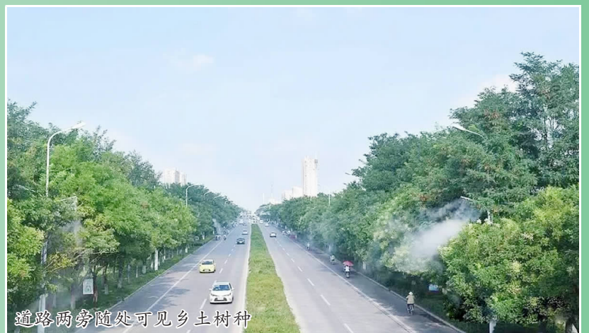
道路两旁随处可见乡土树种

繁花绿树满睢宁。近年来,我县积极打造精品园林城市,统筹实施园林绿化工程,加强园林绿化管理养护力度,推进城市道路等基础设施建设,城市园林绿化水平得到全面提升。