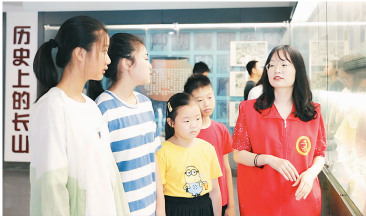
图为我市组织志愿者为中小學生提供志愿讲解服务。

我市建立健全了“群众点单”的工作机制,各镇文明实践所和村(社区)的文明实践站,均有专管员负责“群众点单”日常管理,村民可以通过当面交流、电话和互联网的方式对志愿服务的内容和方式提出意见和建议。村民组长、村民代表不定期上门“询单”,文明实践所和村(社区)的文明实践站会根据群众点单情况,筛选项目,制定方案,选定志愿者。