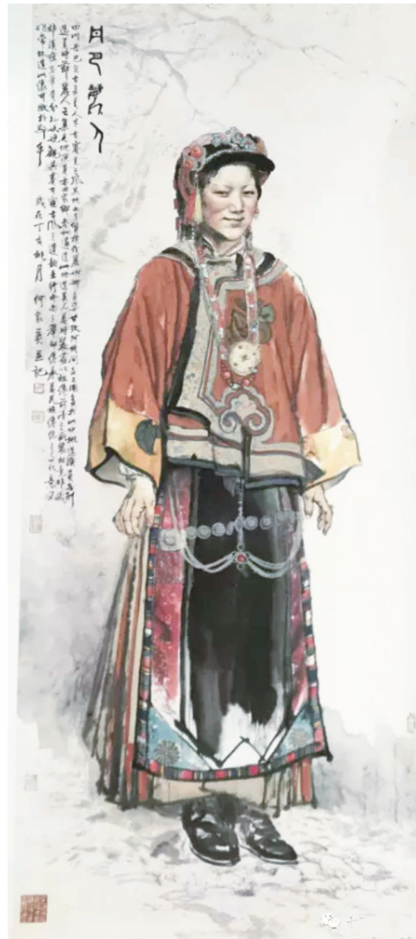
▲ 何家英(中国艺术研究院)