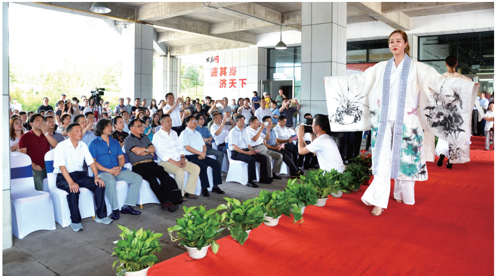
▼ 开幕式前的独特开场秀