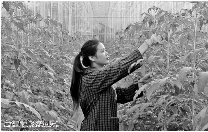
嘉纳庄园(资料图片)