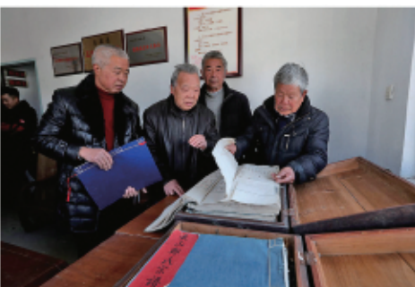
村里的老人在查阅宗谱