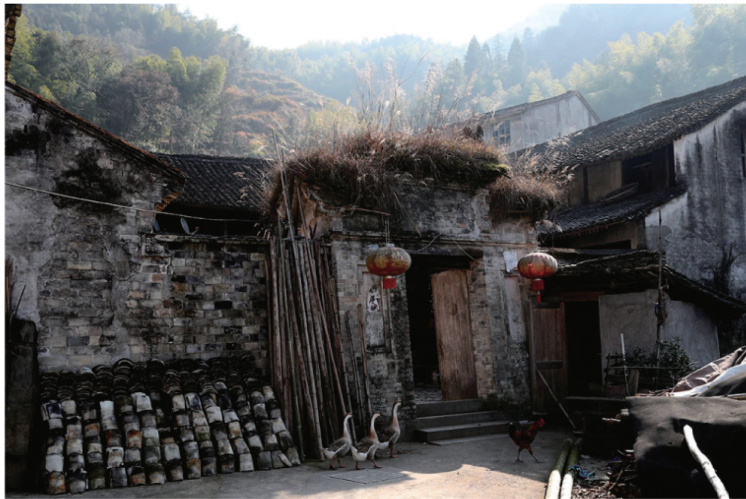
村里还有多处这样的老宅

“表山地方水流西，子孙代代穿锦衣”这是当地人唱过的一首民谣，可见此处曾经的富饶。村民皆为郑姓。据《郑氏宗谱》记载，该村建于北宋天圣年间，至今已993年。 《郑氏宗谱》载，1024年，郑氏始迁之祖郑珂是永嘉刺史郑谔的玄孙，携友游楠溪仙居四十九都之表山，见山势雄伟，风景秀丽，确可“表独立”于山上，有田可耕，有水可饮，遂不忍离去，遂自筑八字桥徙此地择地建基树门创屋，建堂屋20余间，开田50多亩，树门两座，讲孝悌以训子孙，创祠堂以奉祖先，一曰“表山”，一曰“莲峰”。莲峰，因表山地方四面环山，位于低洼锅底状的莲花池上(文化礼堂所在的旧址是当时从二十公里之外人工抬运青石条在池边修建而成)，地形像极四莲花，取瑞意吉祥之意。 站在村口碗门岭上，观表山富丽清秀，溪水向西流，悠悠遥思当年，村口挑柴德歌相逢牧笛放牛，斗笠耕农锄耨并叩窗，那真真妙境，宛如一幅田园图。记者思之，如此俊秀珍饈地，当出寒窗苦功人！果真，表山仍富学才高，地灵人杰之地。始祖郑珂出自官宦之家，诗书底蕴深厚，虽避居于山野，然风雅不减，耕读传家。后世学者辈出。郑四保，北宋治平元年(1064)入太学，30岁执下右丞相命署知录书记，后为理寺寺小卿。郑守彬，江淮东道度使。郑珂曾孙郑伯熊(字景望)、郑伯英(字景元)是表山郑氏代表人物，均为南宋进士，他们在永嘉学派形成过程中起着承前启后的作用。现村东口有一巨石上书“宋大儒郑伯熊故里”。郑伯熊堂弟郑伯谦亦为进士出身。清朝有进士郑敦谔，现代有徐定超门生郑冠生和郑侧坐。留美任教的郑九溪教授一门三博士六硕士，更是一时传为佳话。 这些信息记载在《郑氏宗谱》中，而在表山，《郑氏宗谱》是村中一宝，搬起来有一人高的宗谱保存在老人协会中，虽然大部分是遗失损毁后补录的，但其中康熙年间四册仍保存完好。