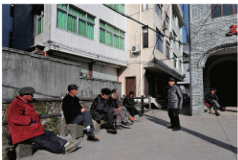
闲坐暖阳下的老人