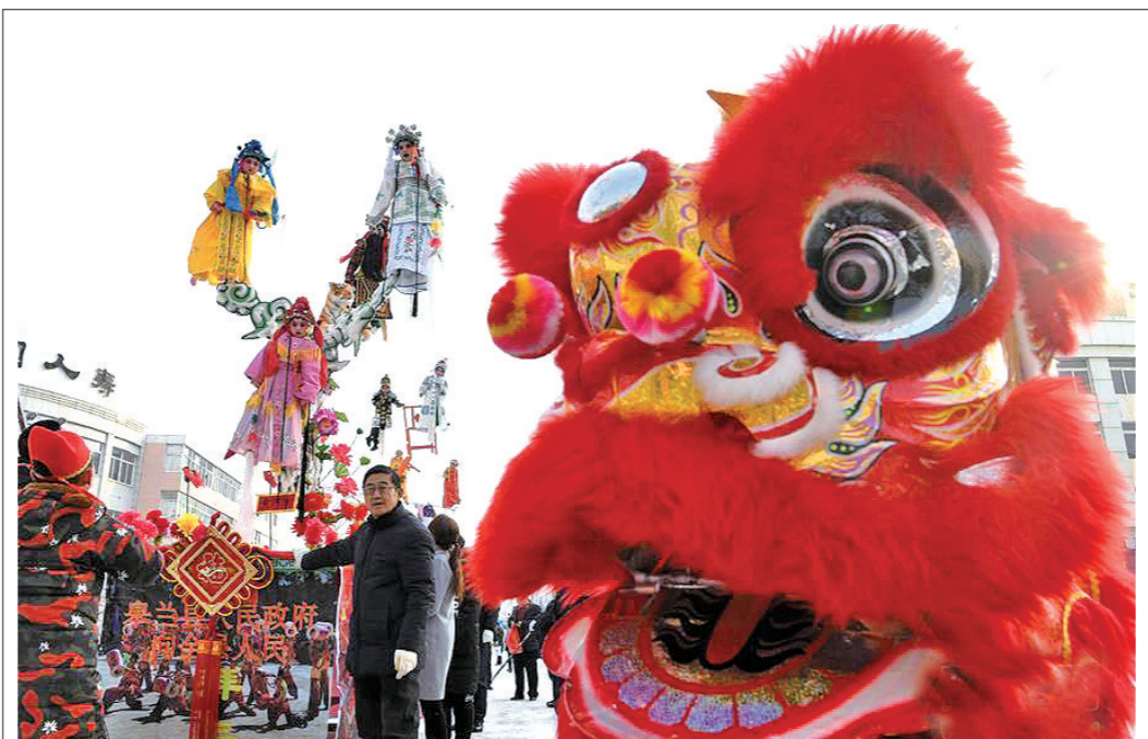
社火巡游庆元宵 2月18日,社火队员在兰州市皋兰县县城街道进行舞狮和铁芯子表演。 当日是农历正月十四,甘肃省兰州市皋兰县春节社火汇演活动拉开帷幕,当地11支社火队共2000多名表演者穿梭于县城主要街道进行巡游表演,欢庆元宵佳节。 新华

护理工作经验和护师以上技术职称。“互联网+护理服务”重点是高龄或失能老年人、康复期患者和终末期患者等行动不便的人群。试点医疗机构在提供“互联网+护理服务”前对申请者进行首诊。 方案还提出,机构或平台应当按照协议要求,为护士提供手机App定位追踪系统,配置护理工作记录仪,使服务行为全程留痕可追溯,配备一键报警装置,购买责任险、医疗意外险和人身意外险等。应与服务对象签订协议,并在协议中告知服务内容、流程、双方责任和权利以及可能出现的风险等,签订知情同意书。 新华