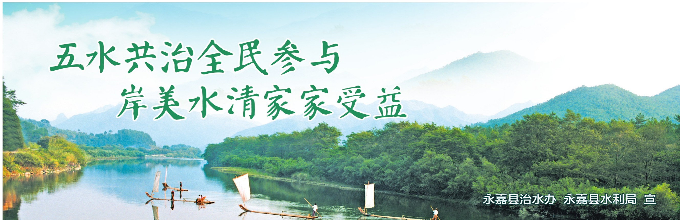
永嘉县治水办 永嘉县水利局 宣

地形条件下的地面目标,而且普通防空系统很难对其进行拦截。 据介绍,新型无人机KYB飞行速度达每小时80公里至130公里,飞行时长达30分钟,可携带3公斤有效载荷。它能在接近目标并实施打击任务后发生自爆。目前该无人机已通过测试阶段并可投入使用。 新华