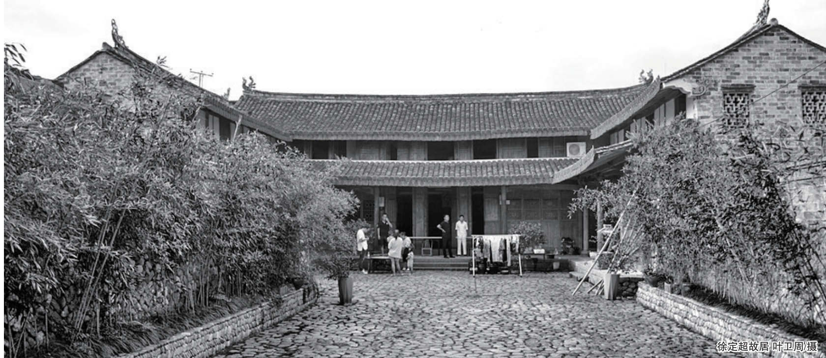
徐定超故居

1904年，浙江省通志局成立，经总纂沈曾植推荐，徐出任提调，并聘请海宁王国维等十位学界名流为分纂。王国维，海宁人，民初随罗振宇东渡日本，研习经史、小学、甲骨、彝器、戏曲等。辞胡适所荐清华大学国学研究院院长一职，仅当教员，为清华五大导师之一。辛亥革命后，徐定超经陈叔通(解放后任人大副委员长)介绍，加入光复会，并转入同盟会。徐定超之孙徐贤修和玄孙徐遐生，先后就任台湾清华大学校长，“贤名传遐邇，修德沐生徒”。