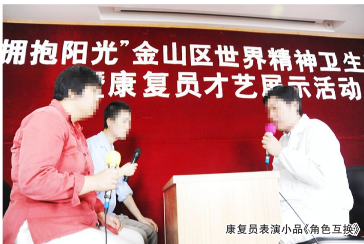
康复员表演小品《角色互换》

此次参加“拥抱阳光”才艺展示活动的康复员,都来自于全区各街镇、工业区的阳光心园,阳光心园是一所集日间照料、心理疏导、娱乐康复、社会适应能力训练等功能为一体的精神残疾人日间康复照料站。早在2006年山阳镇就成立了首家阳光心园,如今,阳光心园已在我区全覆盖。阳光心园让更多处