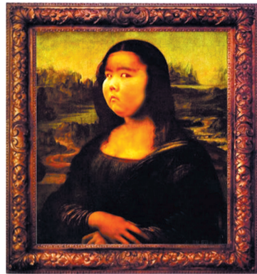
网络小胖被PS成蒙娜丽莎