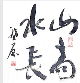
山高水长(书法) 李璠原 书