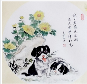
双犬赏菊(国画) 朱景龙 作