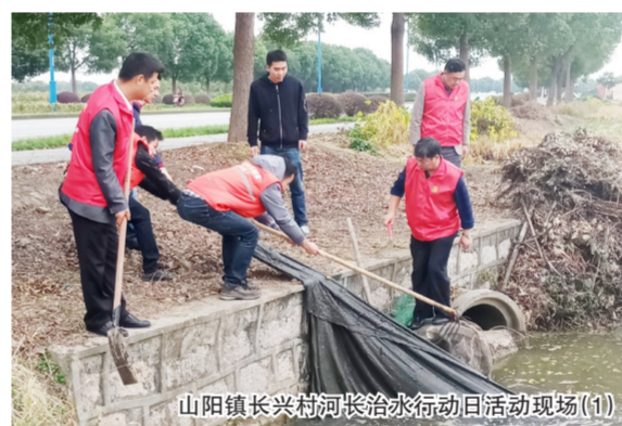
山阳镇长兴村河长治水行动日活动现场(1)

第二点位为时家宅河的水域网簾，由于河道淤积深陷，很难整体拉出，需要多人作战，通力协作。大家干劲十足，撸起袖子，发扬不怕脏不怕臭的精神将满是臭淤泥的大型圈河养殖滞留河底的网簾一起拉上来，有效的畅通了此河段的水流速度，进一步调活了水体。