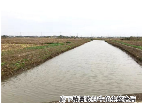
廊下镇勇敢村牛角尖整治后

今年以来，山阳镇坚持以“河长制”为抓手，落实河长管水、联动治水、全民护水，上下通力协作、快速行动，全力推进辖内消黑清劣工作。如今，村级河长每周巡河已成常态，河长制河长坚持“水岸共治”，针对河岸船屋、河坡垃圾、秸秆下河、围河养殖现象，协同各村居护水志愿服务队一起“清河岸、清河障、清河面”。全民参与、齐心协力守护一河清水。