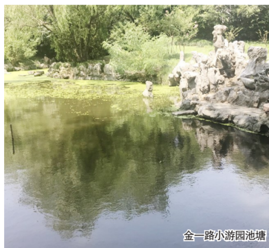
金一路小游园池塘