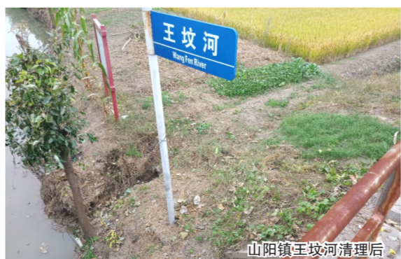
山阳镇王坟河清理后