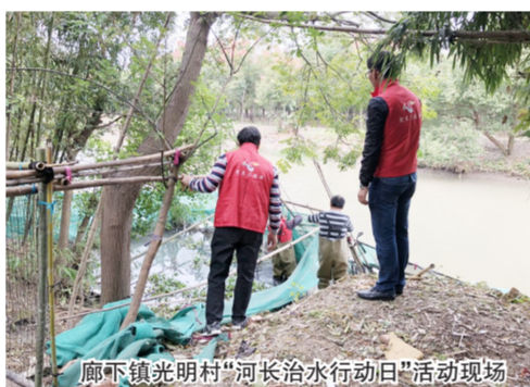
廊下镇光明村“河长治水行动日”活动现场

11月5日，廊下光明村与勇敢村组织村级河长及护水志愿者总计50余人，联合开展河长治水行动。对村内劣V类河道的占河畜禽养殖及河岸垃圾进行集中清理整治，重现水清、河畅、岸绿、景美。集中行动中，大家拿起镰刀扫帚，清理河岸杂草；有的手持长长的捞网，一点一点的清理河面漂浮垃圾；有的索性直接下到河岸边，一起拆除占河畜禽养殖。经过持续的努力，河面又渐渐恢复了往日的洁净。