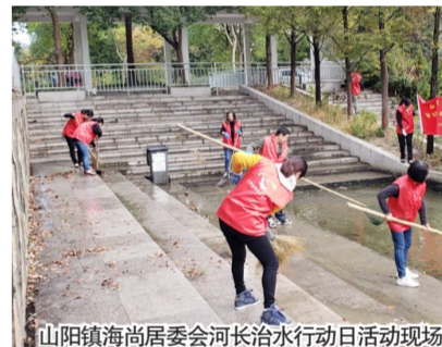
山阳镇海尚居委会河长治水行动日活动现场(2)