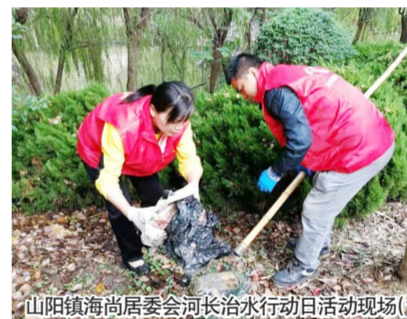
山阳镇海尚居委会河长治水行动日活动现场(1)

11月5日下午，山阳镇海尚居民区党支部携手两新党员开展以“党员进社区，助力创城迎进博”为主题的党员治水护水先锋行动。