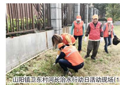
山阳镇卫东村河长治水行动日活动现场(1)

11月5日，山阳镇卫东村组织十余名村民、护水志愿者对卫东杨家河开展了治水护水行动。