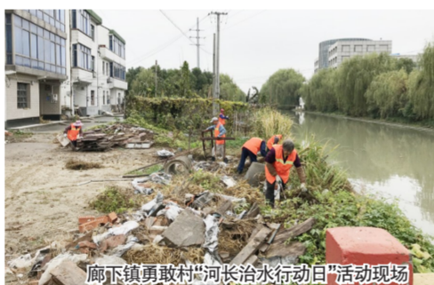
廊下镇勇敢村“河长治水行动日”活动现场