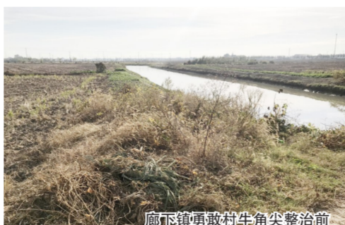
廊下镇勇敢村牛角尖整治前