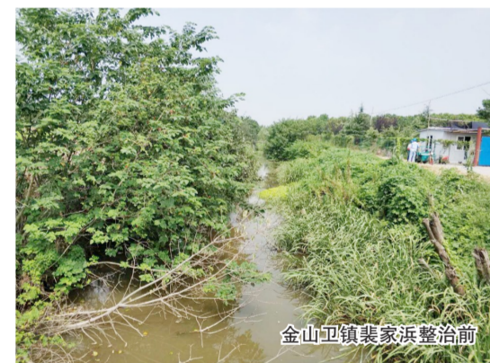
金山卫镇裴家浜整治前