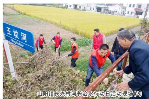
山阳镇长兴村河长治水行动日活动现场(2)