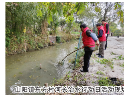
山阳镇东方村河长治水行动日活动现场

11月5日，山阳镇东方村组织护水志愿服务队，针对此前发现的南阳港路南侧、红旗港北侧与向阳村交界处的一段小微水体整治后又出现的占河养殖回潮现象，开展了治水护水专项行动。