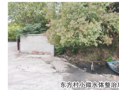
东方村小微水体整治后