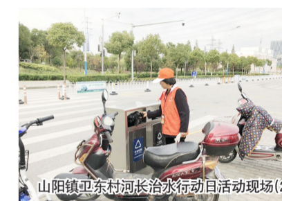
山阳镇卫东村河长治水行动日活动现场(2)