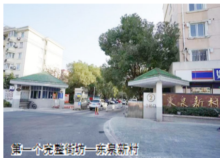
第一个完整街坊—东泉新村