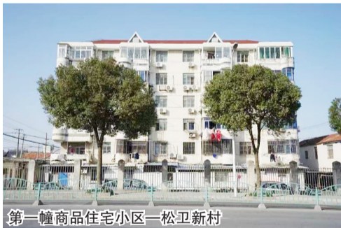
第一幢商品住宅小区—松卫新村

有超15亩的中央绿地,是集文化、娱乐、管理、服务、休闲充分有机结合融为一体的大型项目;在房型设计上,充分考虑购房者家庭结构和起居,使房屋居住功能得到优化和提升;在建筑质量把控上,专业质量监督员全程在施工现场跟踪检验,工程质量全部一次交验合格。正因为步步精心,东泉新村项目不负众望,在市有关部门的考评中,高票当选金山区首家“完整街坊”。同时在首届“上海市优秀住宅”评选中,此项目也斩获“住宅优秀质量奖”。