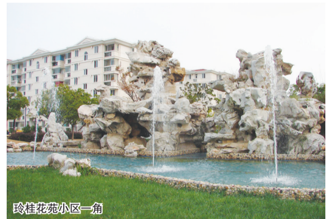
玲桂花苑小区一角

有超15亩的中央绿地,是集文化、娱乐、管理、服务、休闲充分有机结合融为一体的大型项目;在房型设计上,充分考虑购房者家庭结构和起居,使房屋居住功能得到优化和提升;在建筑质量把控上,专业质量监督员全程在施工现场跟踪检验,工程质量全部一次交验合格。正因为步步精心,东泉新村项目不负众望,在市有关部门的考评中,高票当选金山区首家“完整街坊”。同时在首届“上海市优秀住宅”评选中,此项目也斩获“住宅优秀质量奖”。