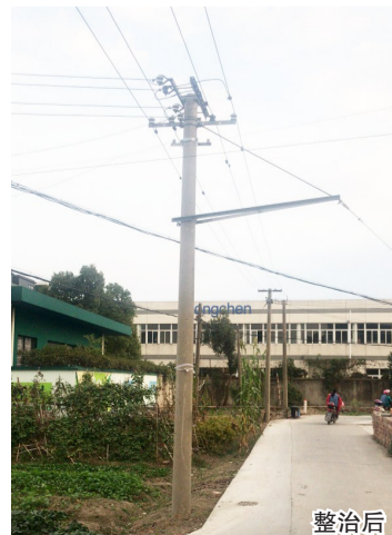
星火村架空线整治前后对比图