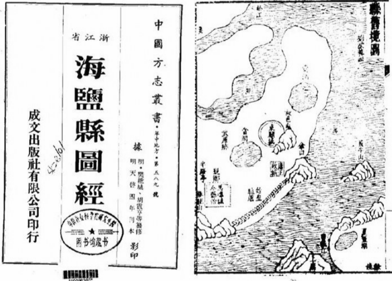
《海盐县图经》记载“康王”故城▲