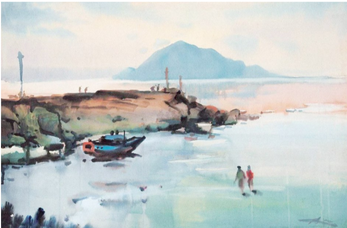
1979年冉熙作水彩画《金山卫海滩》

民国24年（1935年）金祖同对金山沿海作考古后，著《淹城、金山卫访古记》中有如下记载：“金山有所谓康王城者，湮没海中，在未湮时，山与岸连。”