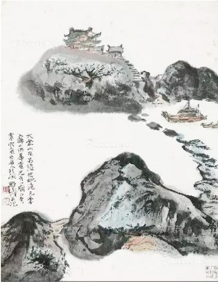
程十发国画《大金山景图》