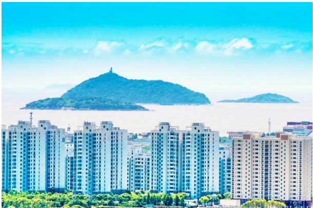
金山三岛