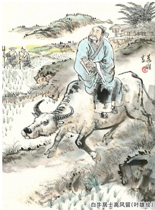
白牛居士高风留(叶雄绘)

历史上,人们曾把朱买臣、陆贽、陈舜俞称为“嘉兴三贤”,并在嘉兴建有“三贤祠”。枫泾境内也建有“表贤祠”,数百年来春秋公祭陈舜俞,文人骚客纷至沓来,留下了许多的题咏诗赋。