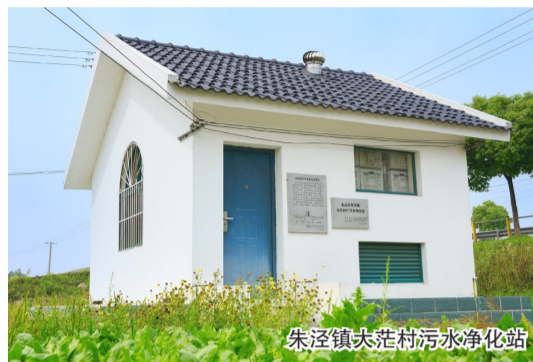
朱泾镇夹港村污水净化站

为持续改善农村环境，提升农村人居环境，响应节水减排新要求，按照中央及市政府关于新农村建设和城乡一体化推进要求，我区结合美丽乡村创建、河道综合整治等，配套村庄改造工作，全面落实农村生活污水处理设施改造工程，对农户的厨房、洗浴以及天井等废水进行全覆盖收集处理。截至2018年底，已完成约4.5万户农村生活污水收集处理任务，农村生活污水处理率达53%，受益人口达17.9万人，总投资约10.18亿元。