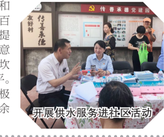
开展供水服务进社区活动

公司以用水问题为导向，以百姓满意为目的，积极发动国有企业公益力量参与社会治理中，以实际行动践行着供水企业的使命担当，彰显国企社会责任。例如金山卫镇横山村在土地改良化和截污纳管改造期间水管多次被施工队挖断，用水问题一度是困扰着村民心头的头等大事，金山卫分公司在得知后，派出人员多次上门查看，寻找漏水地点，以最短的