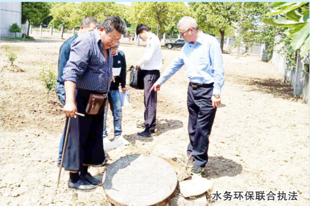
水务环保联合执法

联合开展全区16条骨干河道沿线码头检查。为提高我区16条骨干河道水环境质量，防止码头、船舶污染物排放对河道水质产生影响，规范码头、船舶排污行为，在区河长办牵头下，区交通委、区环保局和区水务局成立专项检查小组，共同开展专项联合执法。如期完成全区61家码头执法检查工作上，对于存在问题的15家码头，执法人员现场发出《整改通知