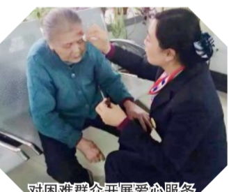
对困难群众开展爱心服务

公司14家营业窗口挂牌建立“爱心小站”，配备人性化服务设施，窗口低位化和无障碍化，提供老花镜、急救箱、饮水机 etc 物品和设施，为户外工作者如环卫工人、协管员、快递员、送餐员等，提供供水供应、避暑取暖、餐食加热、医药箱使用、休息如厕等便利服务。同时通