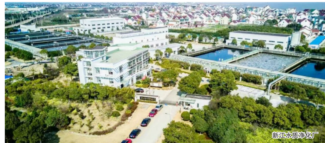
新江水水质净化厂

导致雨污混接的主体主要有五类：市政项目、住宅小区、企事业单位、沿街商户和其他，比如露天洗车、临时大排档违法倾倒等。其中，沿街商户和企事业单位的雨污混接情况最严重，已排查出的雨污混接点中，超过70%来自这两类单位。各类雨污混接问题中，居民小区内的雨污混接问题关注度最高，主要表现在阳台立管清洗污水、小区景观换水等污水通过小区内雨水管道进入市政雨水管道。