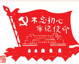
剪纸 吴国盛 作