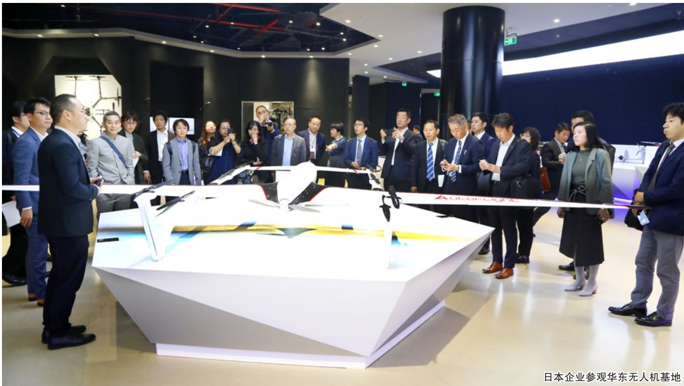
日本企业参观华东无人机基地