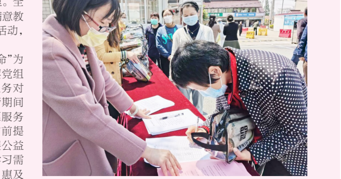
建强堡垒惠万家 惠民生、惠民心

截至日前,142名各级党组织书记共讲党课238节,听课人数5700多人次,受到党员群众的点赞和好评。书记们的党课主题鲜明,学做结合,讲出了见地,讲出了效果。区教育工作党委组织专家评选出10个优秀党课案例、8个优胜党课案例,汇编成《金山区教育系统百名书记精品党课集》,作为基层党组织党性教育学习材料。