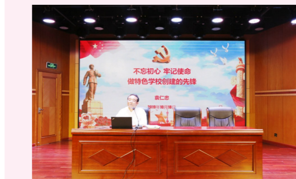
百名书记讲党课 讲政治高度、讲党性修养

截至日前,142名各级党组织书记共讲党课238节,听课人数5700多人次,受到党员群众的点赞和好评。书记们的党课主题鲜明,学做结合,讲出了见地,讲出了效果。区教育工作党委组织专家评选出10个优秀党课案例、8个优胜党课案例,汇编成《金山区教育系统百名书记精品党课集》,作为基层党组织党性教育学习材料。