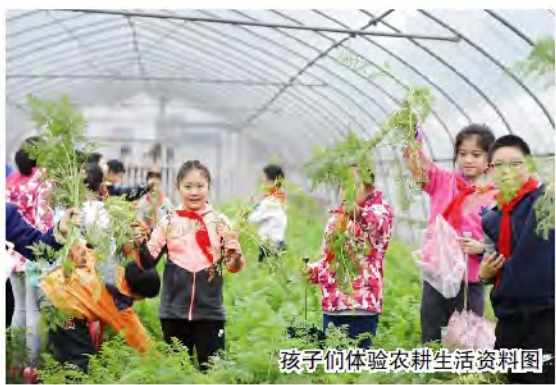
孩子们体验农耕生活资料图

眼下,元旦长假即将来临。找点时间,领着孩子,在吕巷水果公园,享受田园风光的同时,用一次协作、一场劳作,来翻开2021年的崭新篇章。