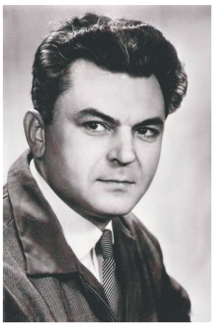
导演邦达尔丘克在电影中扮演了男主角皮埃尔。

由谢尔盖·邦达尔丘克编剧和导演的本片,改编自列夫·托尔斯泰1869年的同名巨著。电影长达6个半小时,于1966年和1967年分四期上映;导演本人在电影中饰演皮埃尔,苏联功勋演员维亚切斯拉夫·吉洪诺夫饰演安德烈公爵,柳德米拉·萨维里耶娃饰演娜塔莎。