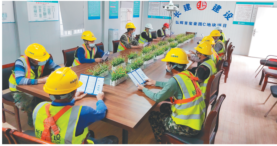
近日,昆山开发区总工会、住建局携手走进辖区工地,联合开展“尊法守法·携手筑梦”系列普法宣传活动。