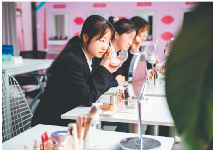
为助力学生求学求职,中南大学为考研和求职的学生准备了多个网络面试间,房间内有专用网络,同时还配有手机支架、补光灯等专业设备。