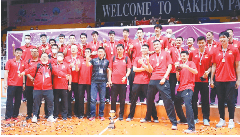
中国男排夺冠后合影

不过,虽然中国男排最终以全胜战绩完成赛前既定目标,但队伍从第二阶段开始,每一场比赛打得都不轻松,这也从侧面说明目前中国男排在亚洲区域内还不具备绝对的实力,能否最终取胜很大程度上取决于队员们的状态以及临场发挥。不仅如此,队员们在比赛过程中暴露出来不少自身存在的问题,尤其是在逆境局面,队员