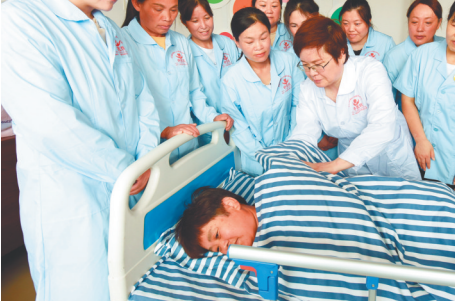
7月24日,东海县晶都职业培训学校教师正在为学员讲解老人护理技能知识。东海县结合人才市场订单用工有价无人的缺口,及时开展养老(病患)护理专业培训,养老护理持证学员已经成为一二线城市医院、养老院、社会救助等地急需上岗工作的“香饽饽”。

常州的繁华,是从老城厢开始的。老城厢,是常州的城市之根、历史之源、文化之脉。这项“打开天宁 寻找多彩老城厢”活动是由天宁街道总工会参与主办的,邀广大职工赏美景、吃美食、获得感,跟随打卡手册领