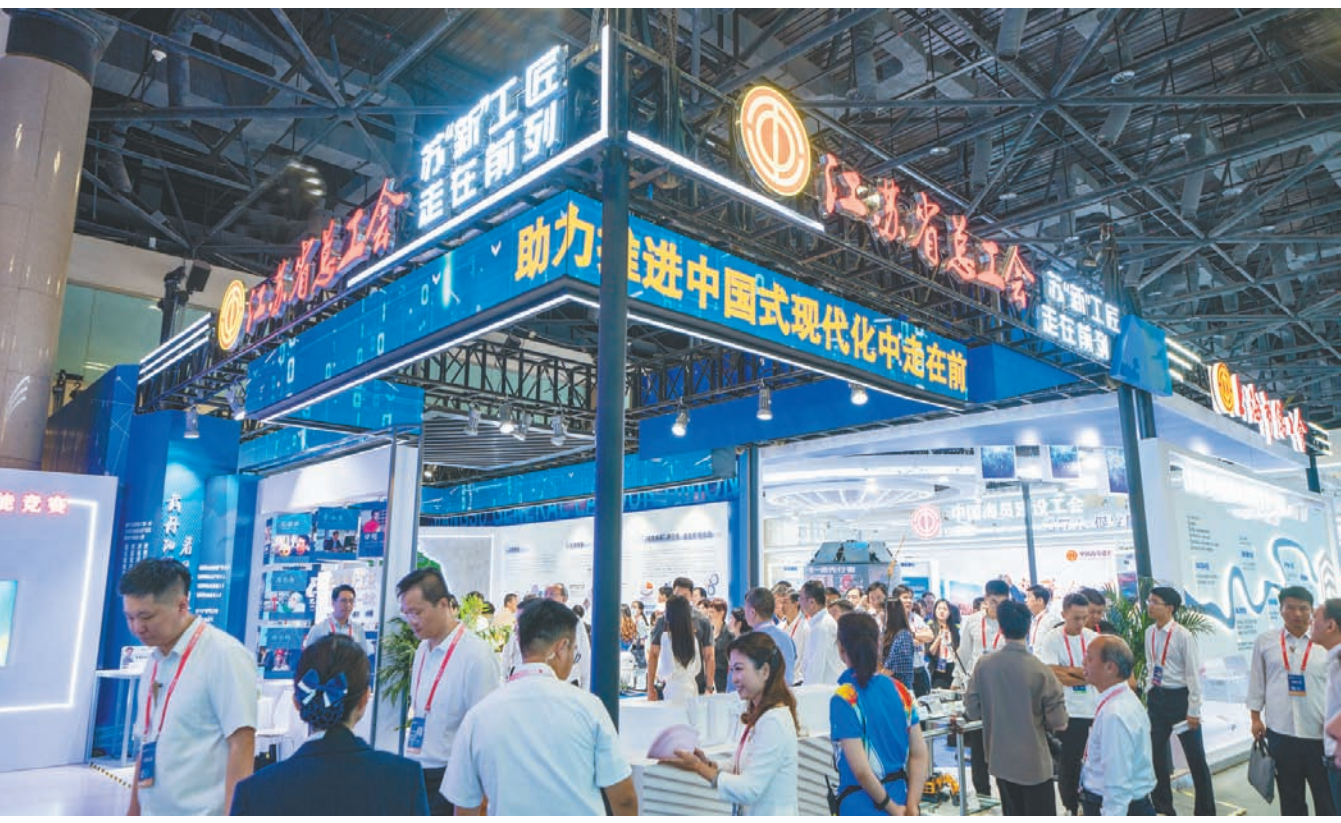
江苏展位人潮如织,江苏职工创新成果引人关注。

7月30日,为期三天的第二届大国工匠创新交流大会暨大国工匠论坛在北京展览馆圆满落幕。大会期间举行第七届全国职工优秀技术创新成果颁奖仪式,江苏取得历史最好成绩,6名一线职工获奖,其中一等奖1个、二等奖2个,遥遥领先其他省市。大会表彰10个最佳组织单位,江苏省总工会位列其中。本报特别报道组在北京现场直击大会盛况,为读者带来精彩报道。更多报道可扫描二维码观看。