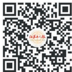
图文报道:张旭 邵劲松 谢丹娜

7月30日,为期三天的第二届大国工匠创新交流大会暨大国工匠论坛在北京展览馆圆满落幕。大会期间举行第七届全国职工优秀技术创新成果颁奖仪式,江苏取得历史最好成绩,6名一线职工获奖,其中一等奖1个、二等奖2个,遥遥领先其他省市。大会表彰10个最佳组织单位,江苏省总工会位列其中。本报特别报道组在北京现场直击大会盛况,为读者带来精彩报道。更多报道可扫描二维码观看。