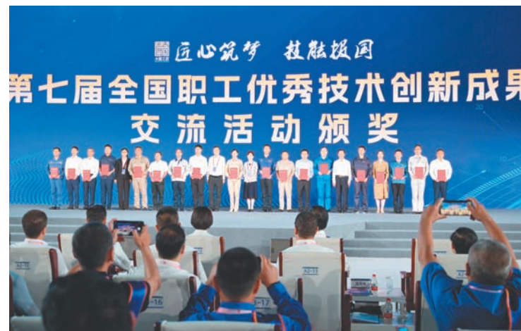
第七届全国职工优秀技术创新成果颁奖现场。