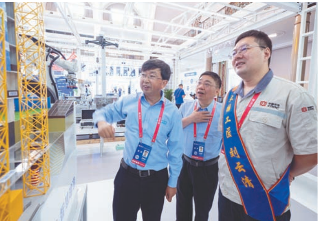
参展的工匠们在交流中得到更多的启发和创新灵感。