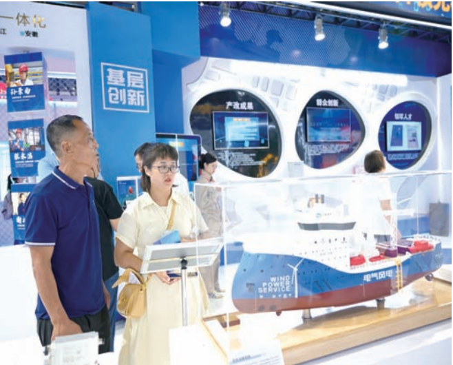
江苏职工创新成果亮点纷呈。