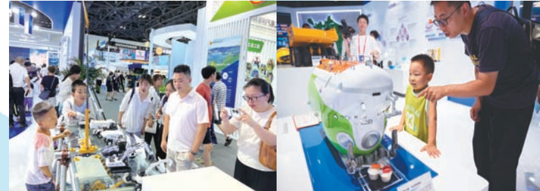
展会现场的江苏职工创新成果引起孩子们的浓厚兴趣。