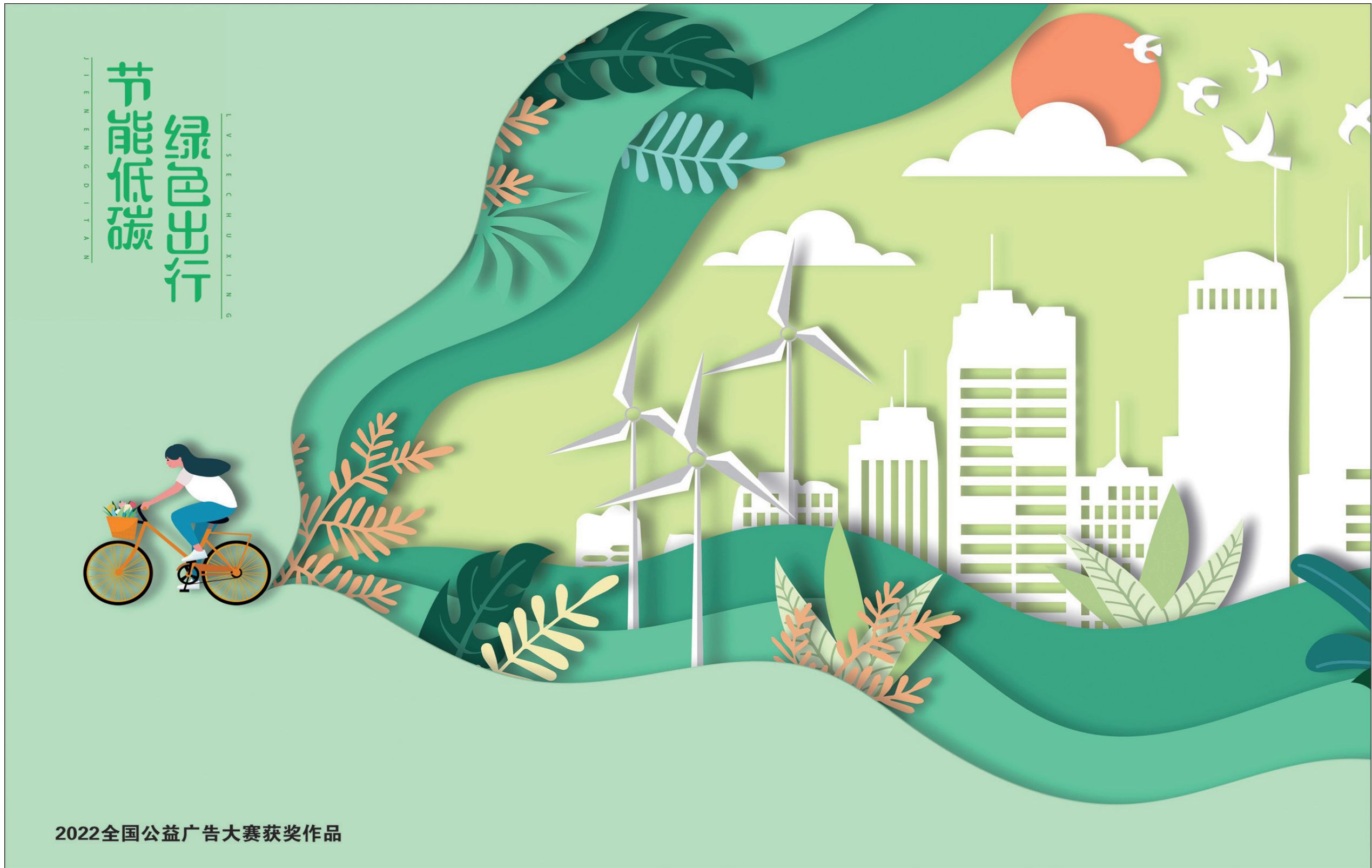
2022全国公益广告大赛获奖作品