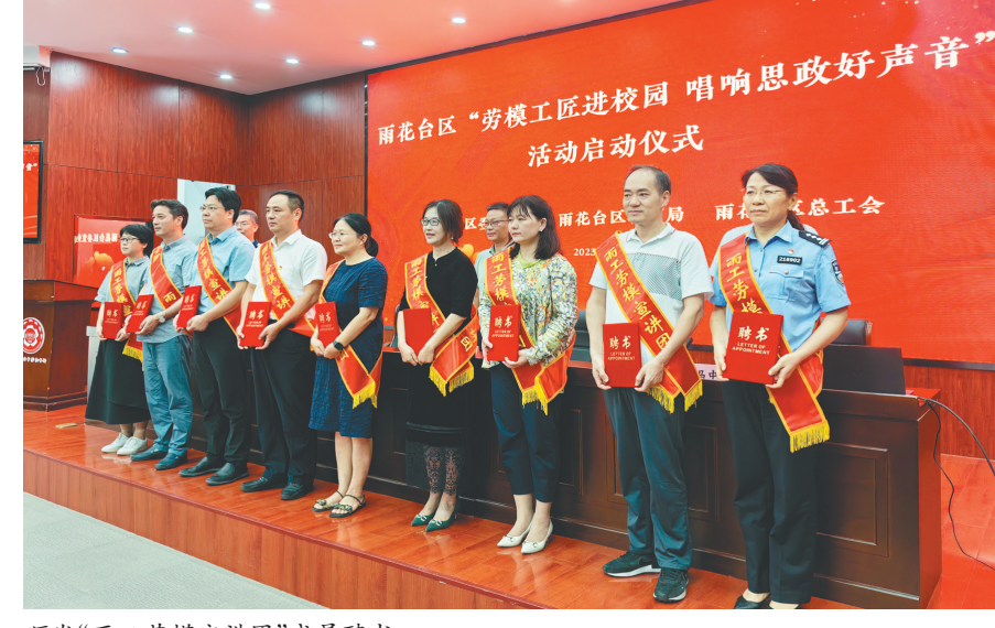
颁发“两工劳模宣讲团”成员聘书

日前,由雨花台区委宣传部、雨花台区教育局和区总工会主办,雨花台初级中学承办的雨花台区“劳模工匠进校园 唱响思政好声音”活动启动仪式在雨花台初级中学启动。雨花台区从各行各业中选出10名劳模代表,组成“两工劳模宣讲团”,通过举办劳模工匠精神进校园、进企业等活动,推进劳动光荣、技能强国理念浸润校园、引领风尚,激励广大劳动者书写用劳动创造幸福的时代篇章。 宁工萱