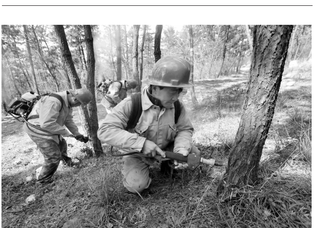
连日来,连云港市林业部门抓住初春松树休眠的有利时机,给松材注射防治松材线虫药液,达到预防松材线虫病的目的,松材线虫病是一种毁灭性病害,被称为松树的“癌症”。据统计,连云港市境内以黑松为主的松林有 1 万多亩。近年来,松材线虫病疫情时有发生。王健民 陆银江 摄

经鉴定,涉案幼虎属国家 I 级重点保护野生动物。此外,除购买幼虎外,2014 年 5 月,赵某经人介绍,通过微信与江西南昌的徐某认识,从徐某处以 8500 元的价格购买一只黄金蟒并出售,警方从扣押手机中发现线索,于同年 8 月在购物网站上发现的灵宝市一家公司的宠物间,将涉案黄金蟒查获。涉案黄金蟒被列为国家 II 级重点保护野生动物。(曾庆果) 编辑 胡子