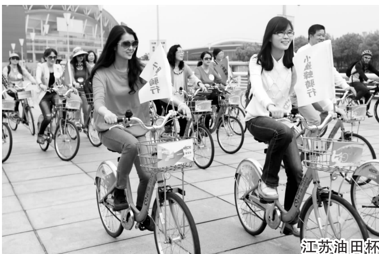
近日,南京市秦淮区地税局工会开展“卓越同行健康骑行”活动,倡导健康生活方式,组织职工围绕奥体中心骑行,陶冶身心,强健体魄,提升职工“精气神”。