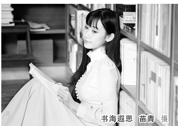
书海遐思

其实,人是靠精气神得以自立的。一个人活在世上,他的强大与否不是体现在财富的多少与地位的高低等方面,而主要体现在他内心的韧性上,而这种精神的韧性如何养成,主要是靠