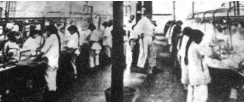
无锡乾丰丝厂女工在监工皮鞭下劳动

27日,罢工工人向全县各界发出了《哀告书》,控诉反动当局和资本家的残酷压迫和剥削,博得社会各界同情。储钱业3000多名男工首先表示支持,酝酿罢工。申新三厂工人和全县人力车工人也作罢工准备。当地地