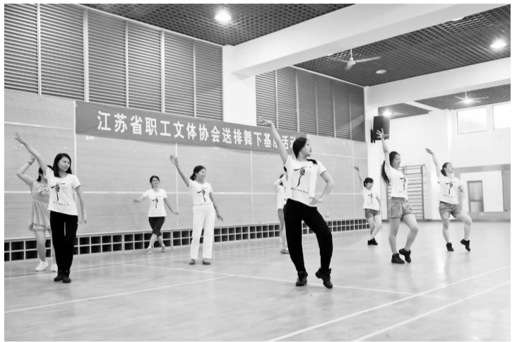
6 月 15 日至 16 日,省职工文体协会在常州纺织服装学院举办排舞下基层活动(常州站)教练员培训班。学员们学习了排舞的曲目、编排、基本步伐等知识。常州有关企事业单位近百位职工排舞活动爱好者和组织者参加培训。(薛延 廖原)

参会人员还观摩了新建成的武进法治文化园。武进法治文化园占地 95 亩,毗邻武进区行政中心、凤凰谷影艺宫等政治文化中心,是由区委政法委、区司法局、区公安局等单位联合投资约 150 万元,在原假日公园的基础上提升改造而成。它以“衣、食、住、行、和”为线索,结合武进本土历史文化,构建五大板块,打造了 26 处法治文化景观,充分展示了武进法治文化的精髓。(罗丹娜 吴文龙)