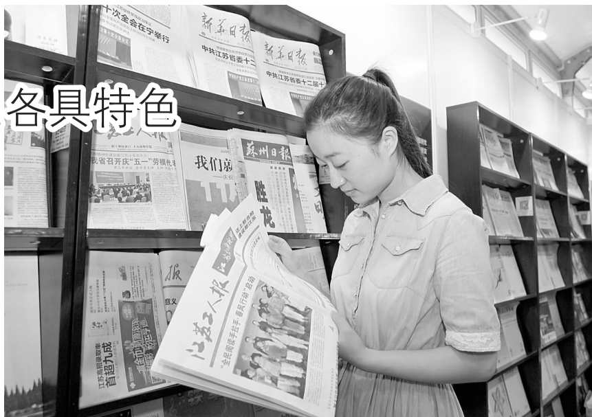
在本次书展的徐州音乐厅展馆,《江苏工人报》被展示在“报刊主题宣传(出版)展区”。

音乐厅展区设置湖畔书香馆、特色书店馆、文艺馆、亲子阅读馆、港台馆和农家书屋团购,特色书店馆由来自南京的“先锋书店”的布展,每一本书都是店长精心挑选从南京运达。此次参加展览的图书多为社科类、创意类产品,讨论传统文化的先锋杂志《碧山》、摇滚乐队专著《披头士》、《如何看一幅画》、《爱与黑暗》,这些书籍带我们进入一个个有趣的世界!此外,湖畔书香馆还展出绝伦《瓦尔登湖》、狄更斯《百年孤独》、柴静《看见》等精品好书。文艺馆为我们呈现一个文艺浪漫的精神世界,海明威、福克纳、