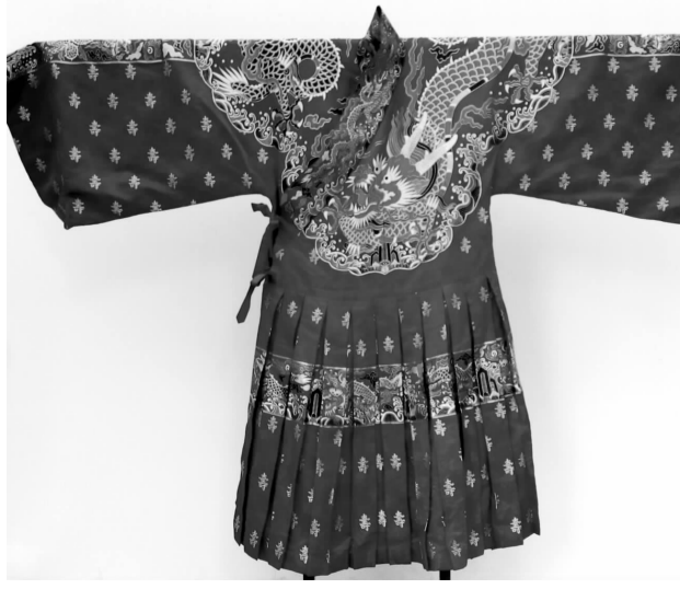
图为在南京德基广场展出的明代万历龙袍复制品。

记者不仅了解到明代万历龙袍的考古经历,还了解到古代皇帝在不同的场合穿不同色彩的龙袍。其中,皇帝上朝时穿明黄色龙袍;祭日时穿白色龙袍;祭天时穿蓝色龙袍。而在结婚、祝寿等喜庆场合,都穿红色龙袍。