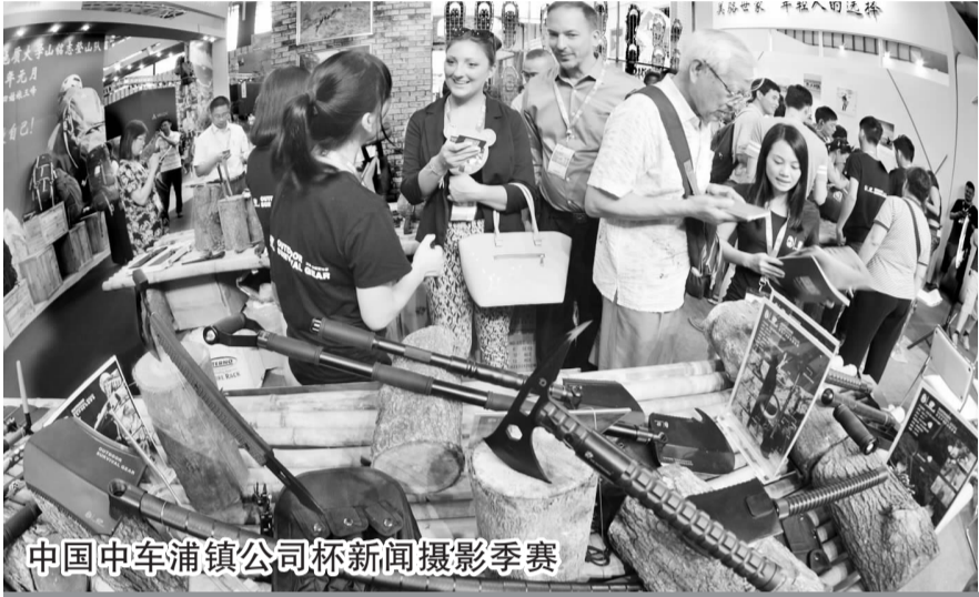
中国中车浦镇公司杯新闻摄影季赛

《意见》强调,外资养老服务机构设立要进一步简化审批流程,提升效能效率,许可机关在受理外资养老机构设立申请之日11个工作日内应作出是否许可的决定;外资养老机构设立及变更根据项目金额由地方商务主管部门负责审批。要优化考核办法,加大外资养老服务项目引进力度,将外资投入养老服务业指标作为现代服务业考核的重要内容,形成外资加快投入养老服务业的积极态势。