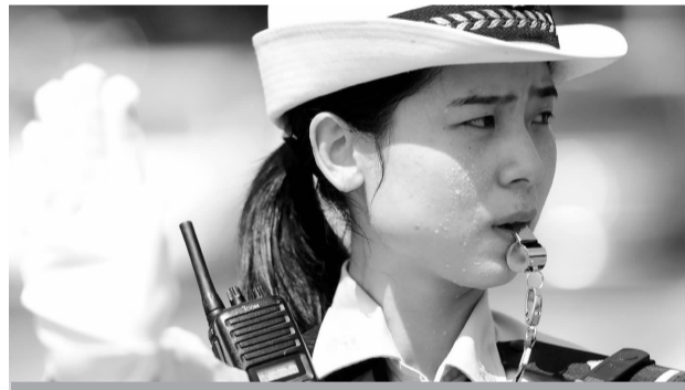
有一种警察，叫“焦警”，他们头顶烈日，脚踩扬尘，即便挥汗如雨，只为保障道路交通安全畅通。

下半年，我省人社部门将会同有关部门制定贯彻《中共中央国务院关于构建和谐劳动关系的意见》的实施意见并抓好落实。另外，持续推进劳动合同扩面提质，依法规范劳务派遣管理，提升联动举报投诉平台和调解服务平台运行水平，加大矛盾调处和监察执法力度，维护劳动者合法权益。沈仁萱 罗刚