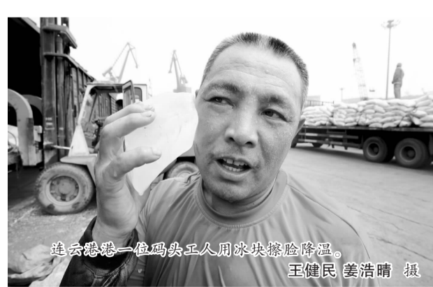
连云港一位码头工人用冰块擦脸降温。