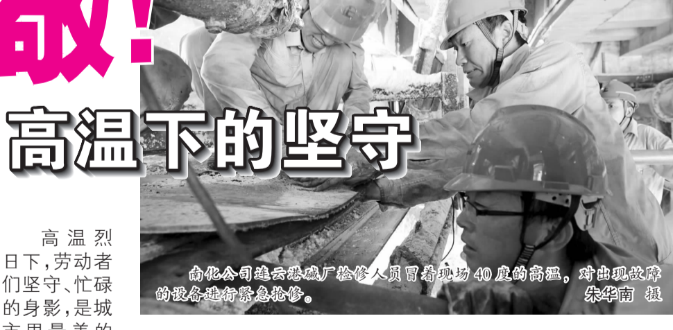
石化公司连云港碱厂检修人员冒着现场40度的高温，对出现故障的设备进行紧急检修。