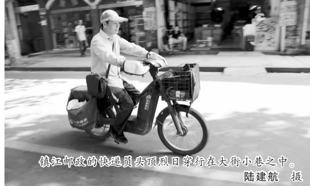
镇江邮政的快递员头顶烈日穿行在大街小巷之中。