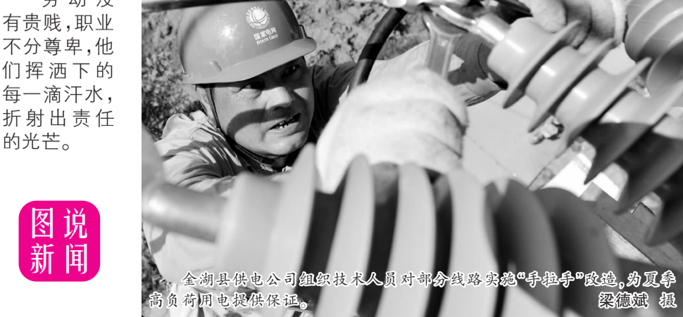
金湖县供电公司组织技术人员对部分线路实施“手拉手”改造，为夏季高负荷用电提供保障。